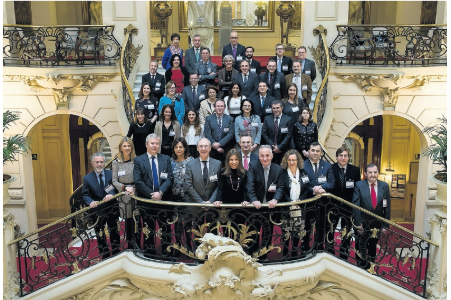
Los directores de las Cátedras de Empresa Familiar, durante un encuentro mantenido en Madrid.

También se apunta la conveniencia de dar mayor visibilidad y participación en los actos y